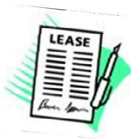
Договор об аренде жилья

Это соглашение между лицом, которому принадлежит квартира, которую вы хотите арендовать (хозяин), и вами (квартиросъёмщик). Условия договора об аренде жилья должны соблюдать хозяин и ваш ребёнок. Если вашему ребёнку еще не исполнилось 18 лет, то договор должны подписать вы.